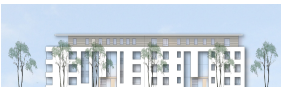
Ansichten Haus an der Planstrasse E