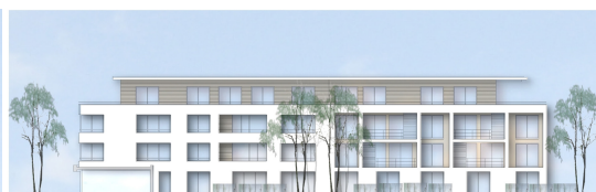
Ansicht von Westen