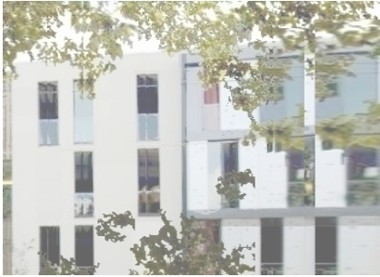
Fassadenausschnitt Haus an der Fessenbacher Strasse_Haus_1