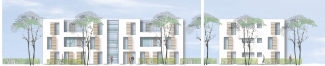
Strassenansicht von Westen