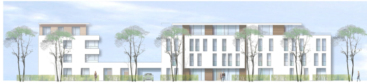
Ansicht Fessenbacher Strasse