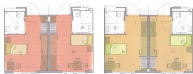
Appartementsvarianten 'ambulant betreute Wohngemeinschaft'_Haus_1