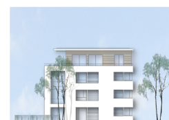
Ansicht von Süden