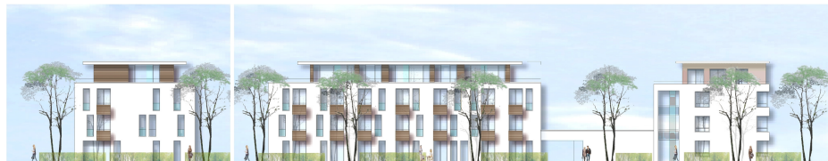
Seitenansicht von Westen