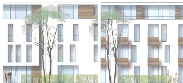
Fassadenausschnitte Haus an der Fessenbacher Strasse_Haus_1

Der so gestaltete Garten entspricht in besonderem Maße dem Gedanken des Zusammenlebens von mehreren Generationen. Er ist bewusst als Treffpunkt konzipiert, wo im Gespräch oder in gemeinsamen Garten- und Freizeitaktivitäten soziale Kontakte geknüpft werden können.