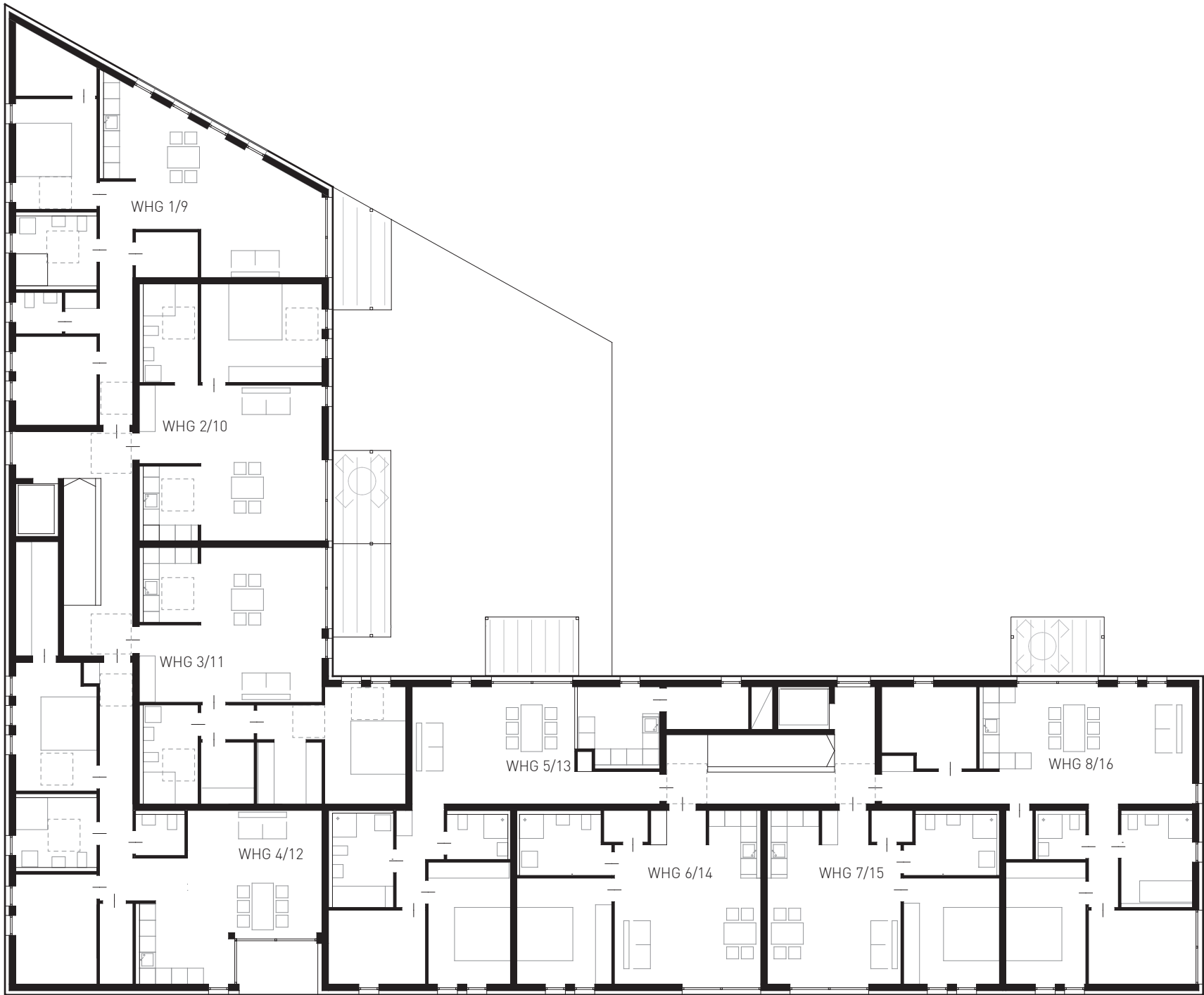
1. & 2. OBERGESCHOSS FFB +4.00 / +7.00 = 171.10 / 174.10 ü.N.N.