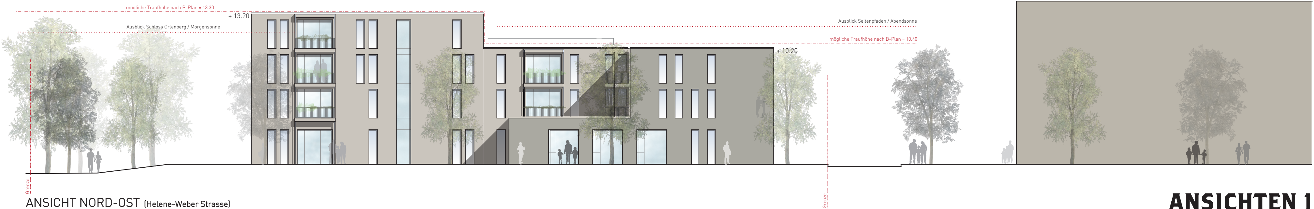
ANSICHT NORD-OST (Helene-Weber Strasse)