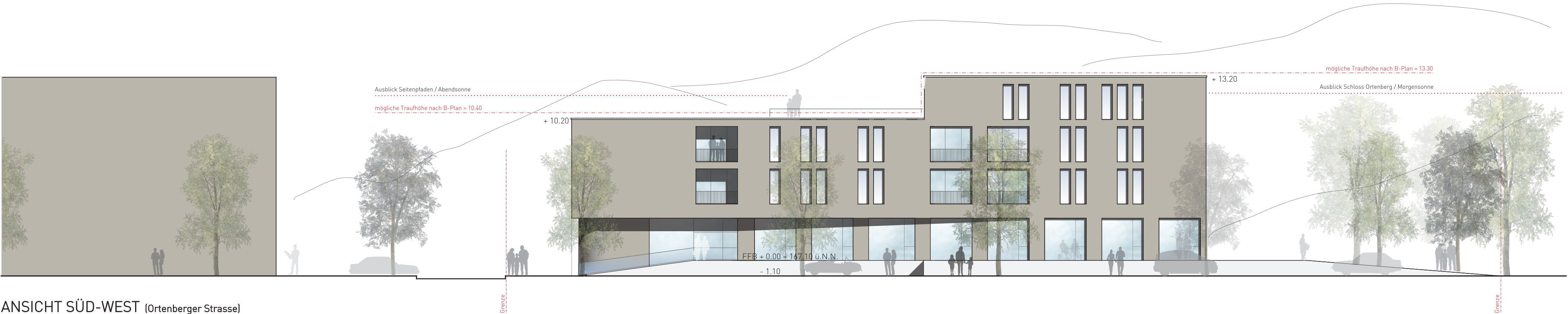
ANSICHT SÜD-WEST (Ortenberger Strasse)