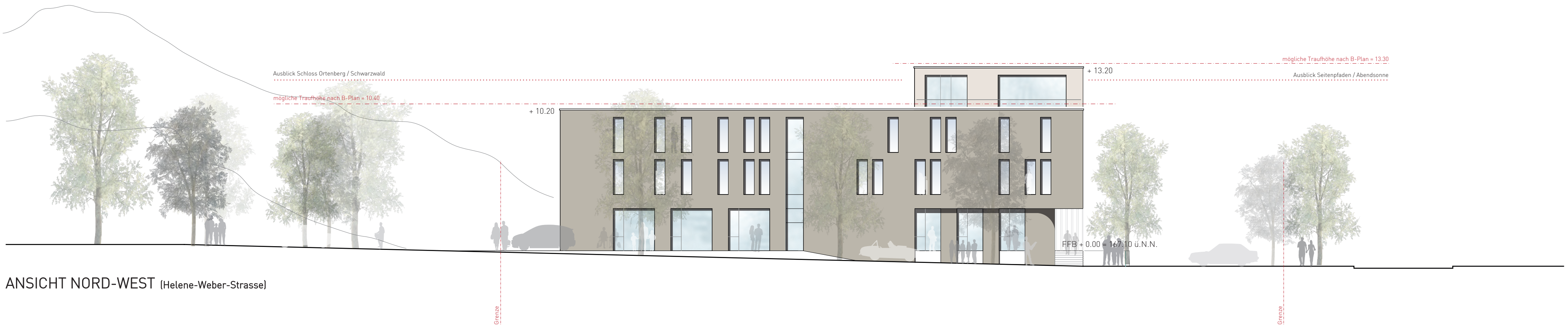
ANSICHT NORD-WEST (Helene-Weber-Strasse)